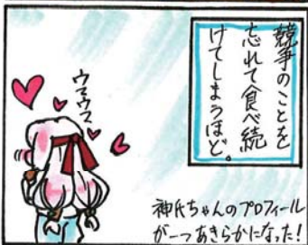
(山田高校マンガ部)