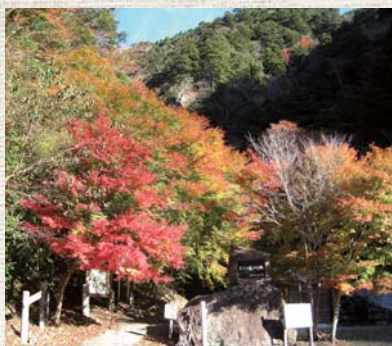
▲遊歩道入り口。秋は見事な紅葉が

※大荒の滝へは国道195号線から朴ノ木に架かる新在所橋を北岸に渡り東へ。道路の看板を目印にお越しください。また、遊歩道は一部に落石等があります。ご注意ください。