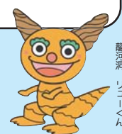
◎やまはたかし 龍河洞、リコーくん