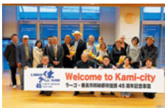
姉妹都市提携45周年事業

タンパ湾に面した大きなまちで、ベッドタウンとして栄えています。旧土佐山田町のライオンズクラブ会員が、国際感覚を持った青年を育てたいと姉妹都市締結の動きが進み、昭和44年7月11日旧土佐山田町役場議場にて調印式が行われました。平成4年には山田高校とラーゴ高校が姉妹校提携を結び、短期留学などの交流が続いています。