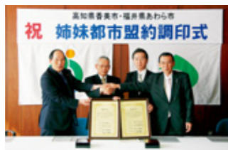
平成21年3月1日の調印式