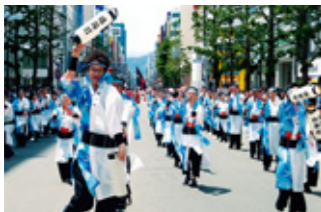
よさこいチーム 「ヤーレンソーラン積丹町&香美市」

よさこい鳴子踊りに惚れ込んだ北海道大学の学生たちが本場で踊りを披露するには、120名の大所帯が格安で宿泊できる施設が必要でした。そこで受入れを快諾したのが、旧土佐山田町です。平成4年に生まれた縁は、よさこいチーム「ヤーレンソーラン積丹町&香美市」を結成するまでに至り、平成14年6月に晴れて姉妹都市提携がなされました。