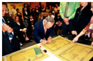
姉妹都市提携40周年記念の調印式(平成22年2月5日)