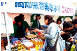
あわら市との交流「観月の夕べ」

当時石川県金沢市で開催された「高知県物産展」で、お互いの拠点であるJR駅の姉妹提携の話が縁となり、香美市の旧町村とあわら市の旧町で、昭和48年8月2日に姉妹都市提携を締結しました。同時に「菅原温泉駅」と「土佐山田駅」が姉妹駅提携をしています。合併後平成21年3月1日に再調印を行い、祭り参加などの相互交流を行っています。