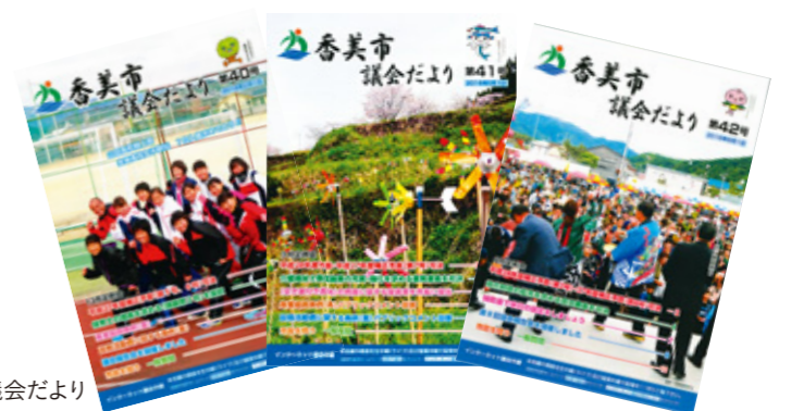
香美市議会だより