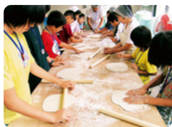
豆腐、こんにゃく、手打そばなど田舎料理の体験

忘れつつある里山の暮らしを次世代へ語り継ぐことを目的に、豆腐・こんにゃくづくり、そば打ちなどの「里山の味作り体験」やクラフト体験、歴史民俗資料の展示スペースがあります。香美市の里山の暮らしを、見て・ふれて・体験することができます。