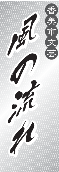
【短歌】 岡崎 桜雲 選

毎年、日本の各地で災害が発生し、尊い命が失われています。災害の発生を防ぐことはできませんが、日ごろの備えで被害は大きく抑えられます。今回は土砂災害を中心にお伝えしました。災害には、地震・津波・台風・落雷などの自然災害のほか、原発事故やテロ攻撃などの人為的なものがあります。新聞やテレビなどの情報とあわせて、災害に備えましょう。