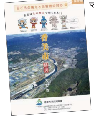
▲香美市防災のてびき

土砂災害は、一般に1時間20mm以上、または降り始めてから100mm以上になったり十分な注意が必要です。 市では、香美市における河川のはらんなどによる浸水想定区域や土砂災害の危険箇所など、災害時の避難箇所等を表示した防災マップを作成し、香美市防災のてびきに挟み込み、各家庭に配布しています。今一度ご確認ください。災害時の減災対策としての活用をお願いします。防災マップ