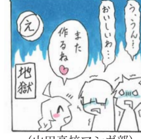
(山田高校マンガ部)