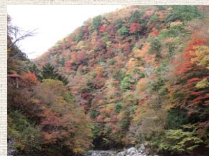
▲山深い地に多くの歴史が眠る

古代土狭國(土佐国)と大和朝廷が交流のあったことは、古墳や銅鐸、窯業などの状況から分かっています。このころ本州と土佐を結ぶ主要道は、瀬戸内から伊予国(愛媛県)回りで、西方からの往来が多かったと考えられています。しかし、別府から四足峠を通過して阿波国へ入る道(横山往還)は最短ル