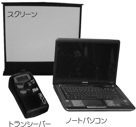
ノートパソコン トランシーバー