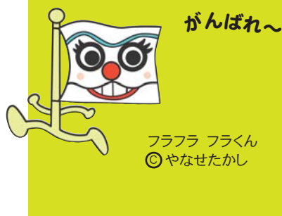
フラフラ フラくん ©やなせたかし