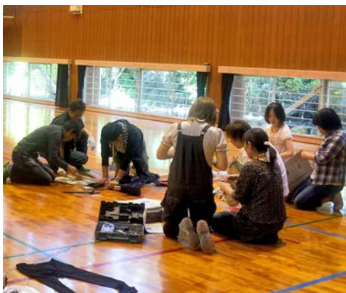
▲参加者でかがしを制作

宮ノ口自治会(土佐山田町宮ノ口)の東屋設置に、元気な集落づくり支援事業費補助金が活用されています。