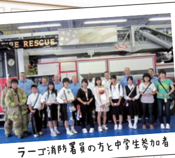
ラーゴ消防署員の方と中学生参加者