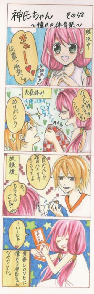
作:鳴鉢 ウノタ (山田高校マンガ部)

◆節電の取り組み(第14回かみかみクイズから) エアコンより扇風機を極力使用したり、部屋の電気をこまめに消したりしています。炊飯器は家族はできるだけリビングに集まり、使用する電灯数を減らしている。