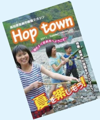
▲Hop town 表紙

香美市で体験型の活動を行っている施設や団体、地域で作られている特産品などをもっとたくさんの人に知ってもらい、香美市が元気になっていくようにと、香美市地域雇用創造協議会が香美市の情報誌Hop town (ホップタウン)を発行しました。 創刊号は、夏休みの宿題に役立つものづくりや体験学習、遊びの特集となっており、市役所や香美市いんふおめーしょんのほか、市内の観光施設等で無料配布しています。