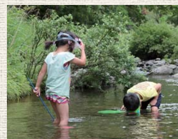
▲水の中を夢中で探す

この魚、川の浅いところにいて捕まえやすく、危険が少ないので、小さい子どもたちの遊び相手にピッタリ。僕も小さいころは近くの川に行って、水中