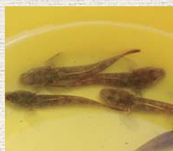
▲愛嬌のある顔でしょ

水中めがねで川底をのぞく。ゴリは体色が砂や石と同化してジッと動かないので、よく目を凝らさないと出会えません。子どもたちも最初はうまく見つけることができないで