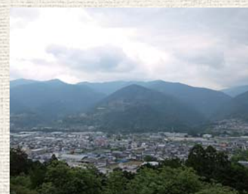
▲香北の町並みが一望できる

整備された遊歩道は少し坂のきつい所があるものの、山野草が好きな人にとっては、楽しみながら散策できる公園ではないかと思えます。