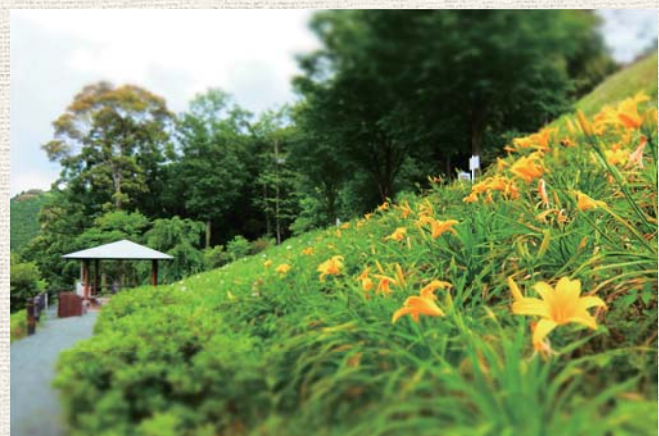
▲見頃を迎えていたトウカンゾウの花が風に揺れます

四季折々、次々と主役を変えるように見頃を迎えていく花たち。園内には花の種類と見頃を伝える看板もあるので、開花に合わせて訪れてみてください。秋にはフジバカマの花が咲き、旅する蝶アサギマダラの吸蜜風景を見ることができるかも。(小松)