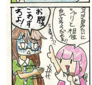
(山田高校マンガ部)