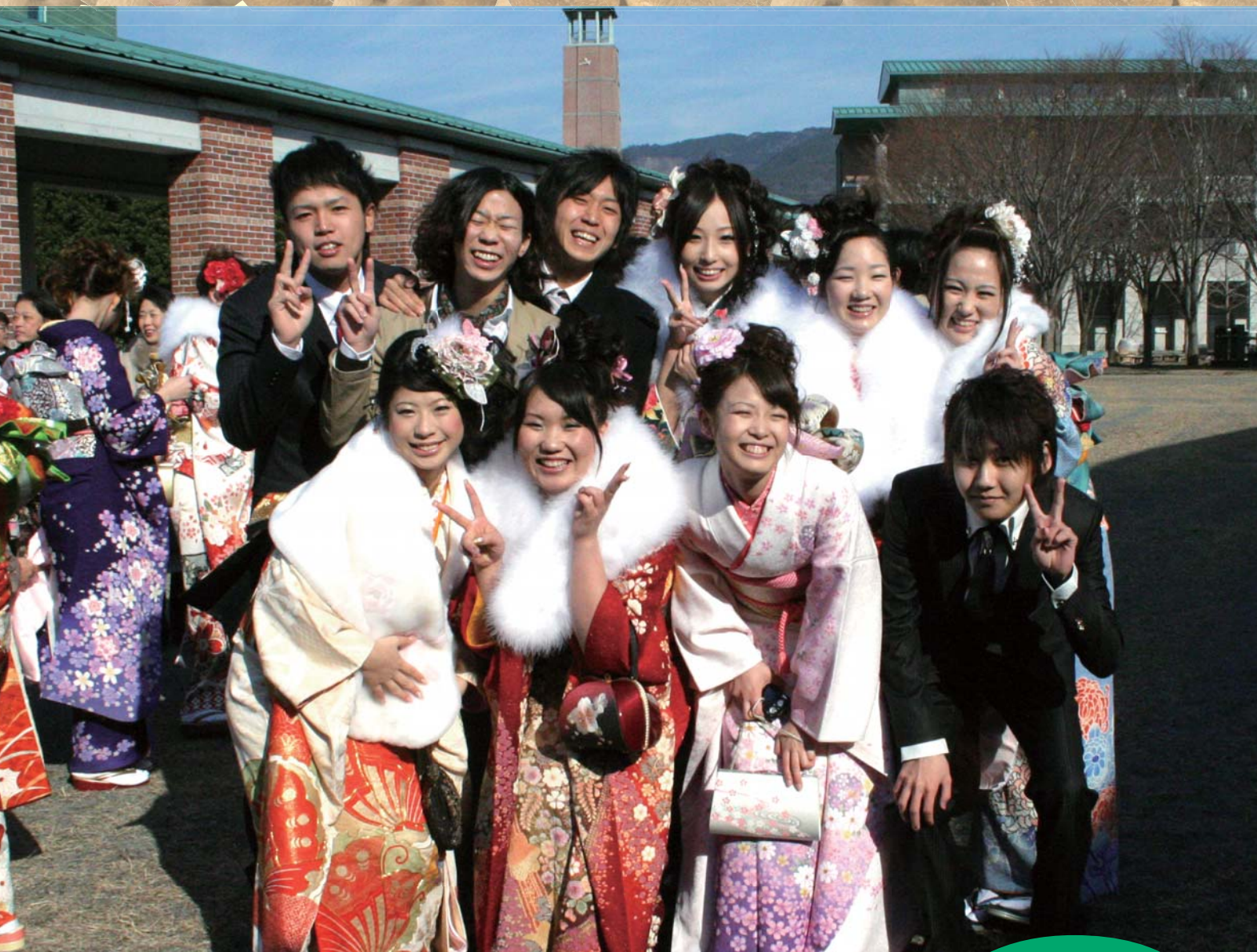
▲香美市成人式（高知工科大学）