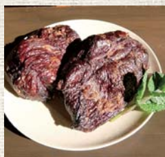
▲迫力満点の燻製肉

網の上にシカ肉を置き、いざ燻製開始。熾き火状態の炭火に乗せたアルミホイルの上に燻製用の桜チップを入れると、煙が肉を包み込み始めます。ダンボールを被せ、チップを足しながら熾き火でじっくりロースト&スモーク。火の番をしながら1時間半ほど燻すと、シカ肉の燻製のでき上がりです。あめ色に輝くその姿は存在感たっぷり。赤身の肉が燻製にぴったりで、スモーキーな香りをまとった野趣溢れる味わいを堪能できます。