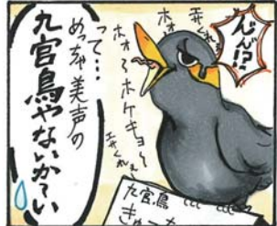
(山田高校マンガ部)