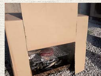
▲ダンボールを活用して燻製

まずブロック肉に塩コショウを満遍なく擦り込む(目安は肉500gに塩コショウ20g)。ラップでしっかり包み込み、冷蔵庫で丸1日寝かせます。そして塩抜き。水を張ったボウルにシカ肉を入れ、軽く水を流しながら約2時間放置。水気を拭き取り、半日ほど陰干したら仕込み完了。さあ、それではお