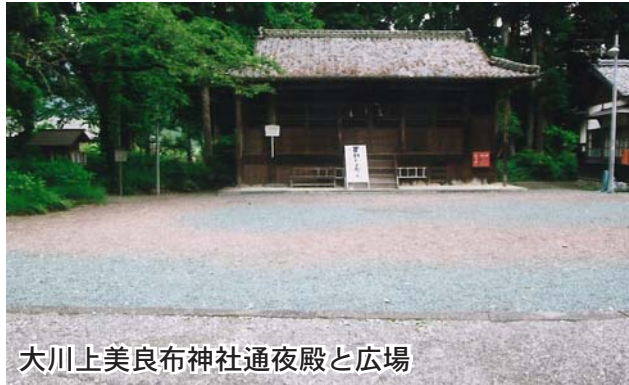
大川上美良布神社通夜殿と広場

この改築には柱・桁・梁に墨書が見られ、資材を各地から持ち寄ったことが分かり、当時の村芝居に寄せる情熱がうかがえる。延享3年(1746)、大阪で菅原伝授手習鑑が人形浄瑠璃で初演され、翌年に川上様の秋祭りで狂言として上演され、近郷から見物人が集まり、