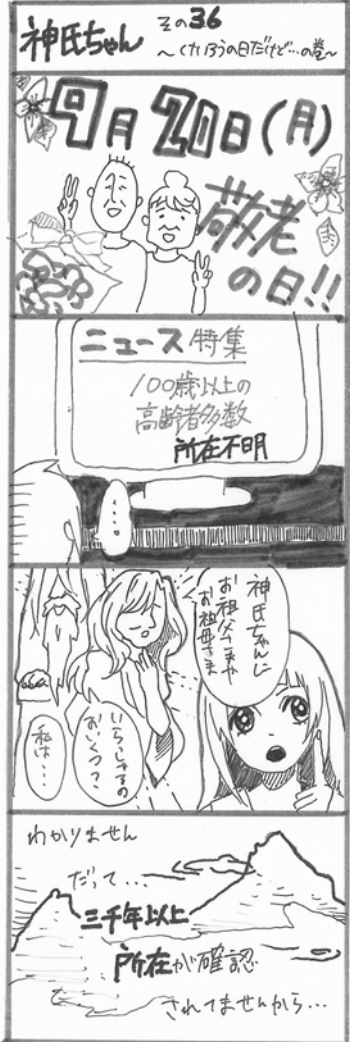
作:山田高校マンガ部

日本へ来たことは本当に良かったです。とても楽しんでいきます。将来、機会があれば、日本へ、高知へ、また来たいです。日本は最高です!香美市の皆さん、これからもどうぞよろしくお願いします。