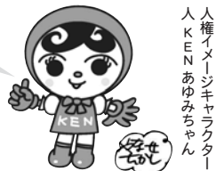
人権イメージキャラクター KEN あゆみちゃん

人権擁護委員は、人権に関する啓発活動や、地域の皆さんからの人権相談を受けるなどの活動を行っています。