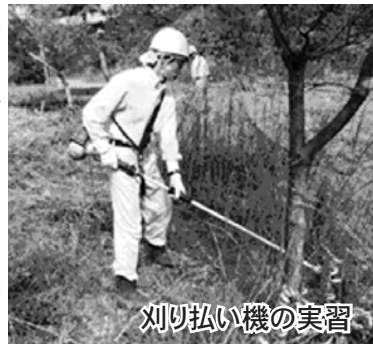
刈り払い機の実習 情報交流館 ☎52-0087

【内容】間伐や下草刈り実習・目立て・刃物の研ぎ方講習等。所定の講座の修了者には、チェンソーなどのライセンスが交付されます。その他、ボランティア行事への参加。