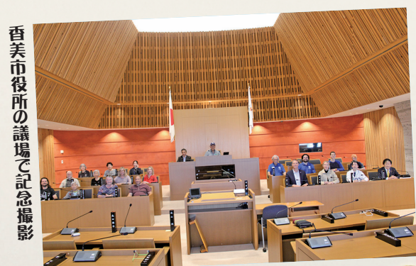
香美市役所の議場で記念撮影