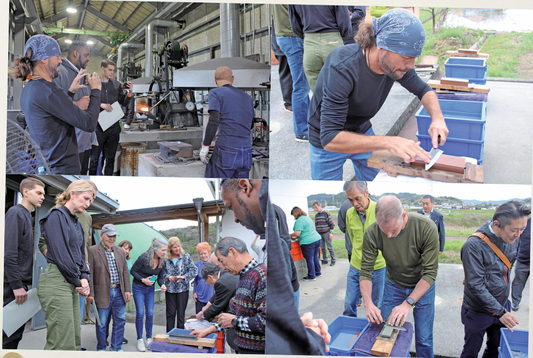
土佐物流センターでの 鍛造見学&刃物研ぎ体験