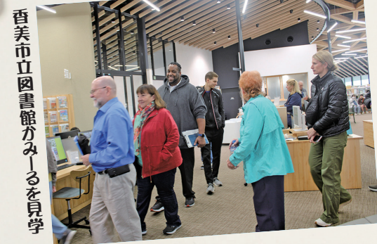
香美市立図書館かみーるを見学