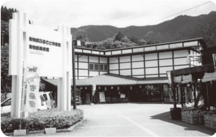
奥物部ふるさと物産館