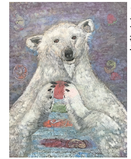
「Peace Happy Birthday」 東孝子