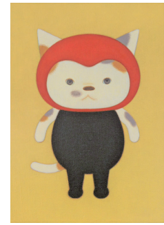
Happy to have cats with me. 「ねこがいてよかった」 カミムラアキコ